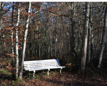
“LA CALZADA” MENDIKO TXOKOAK

Disruta del espectáculo que crea el río Jaundia precipitándose al vacío y escucha el silencio en los rincones escondidos del monte “La Calzada”