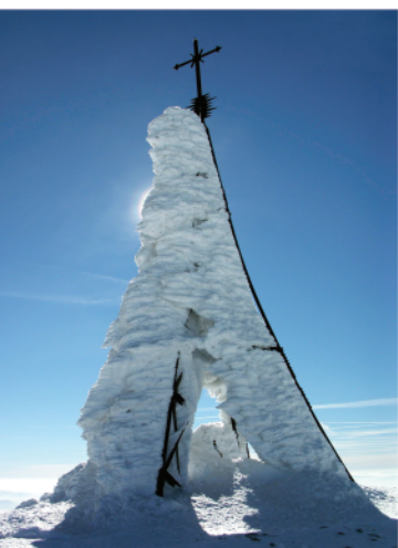
CRUZ DE GORBEIA-KO GURUTZEA

Alcanza una de las cimas más famosas de Euskadi y hazte una foto en la Cruz, símbolo del montañismo vasco.